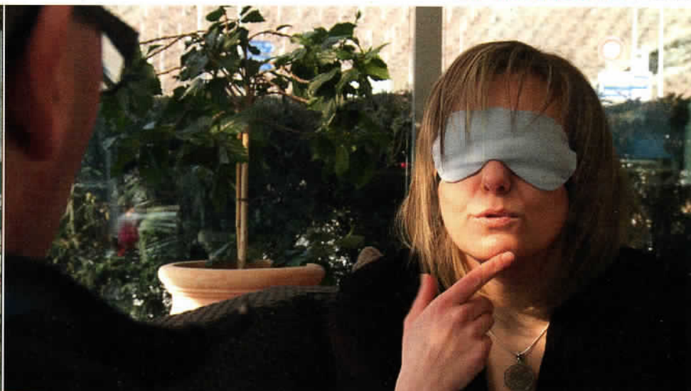
de formation spiritualiste international, où une collègue photographie ses auras.